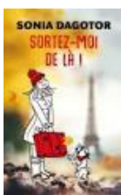
2. « Sortez-moi de là ! » de Sonia Dagotor