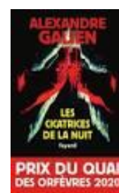
3. « Les cicatrices de la nuit » de Alexandre Galien

Les auteurs francophones ont la cote puisque ils occupent les deux tiers du classement.